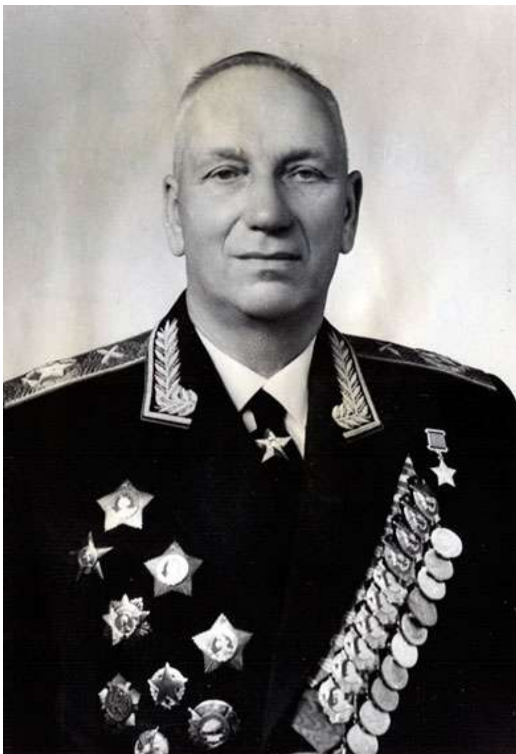
Николай Николаевич Воронов