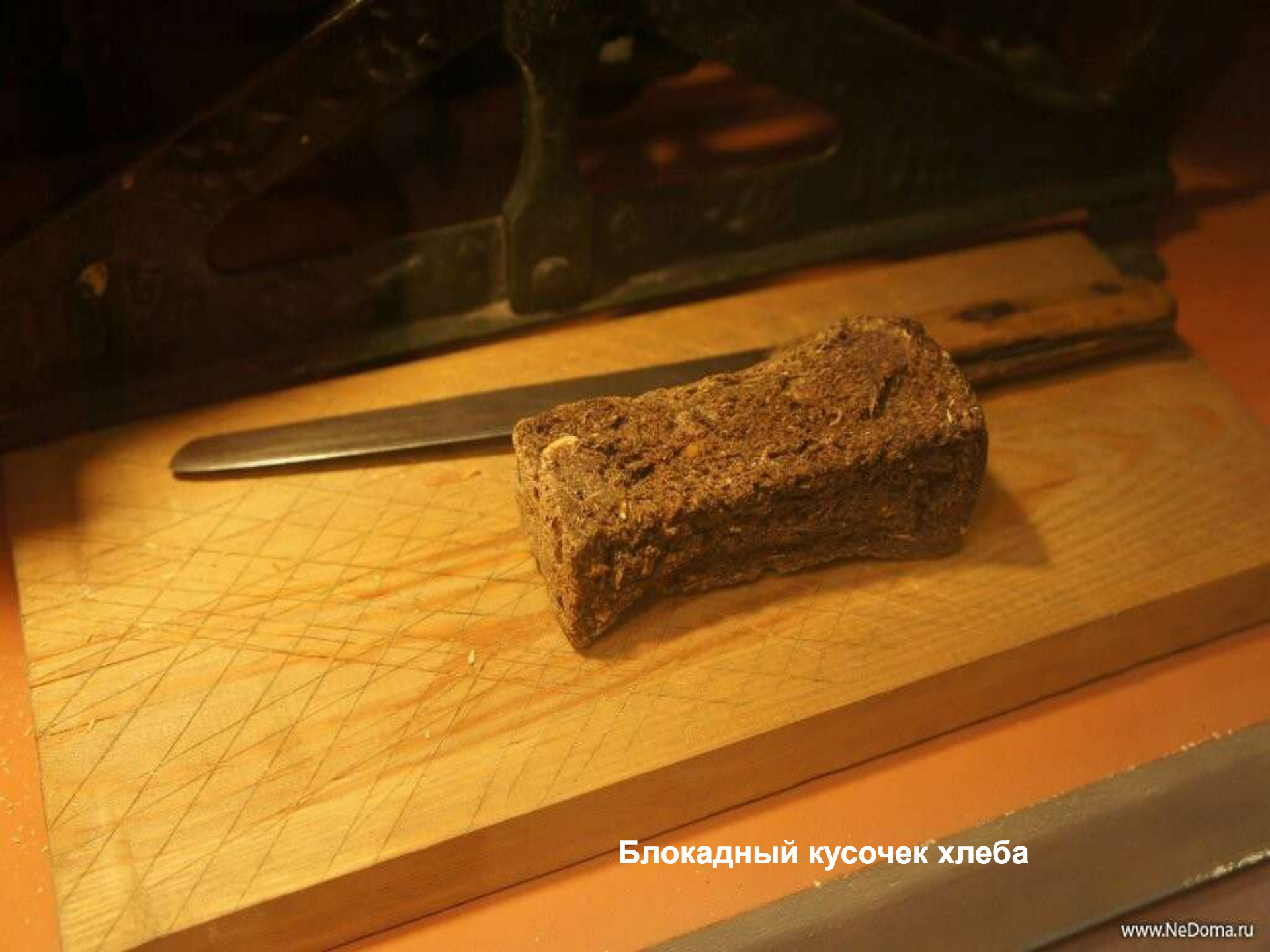
Блокадный кусочек хлеба