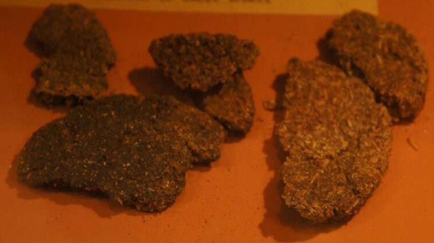
ЛЕПЕШКИ ИЗ ЛЕБЕДЫ С ОТРУБЯМИ, ПОДЖАРЕННЫЕ НА МАШИННОМ МАСЛЕ

СИБИРСКОЕ ПИЩЕВОЕ ПРЕДПРИЯТИЕ С. 20. 140 ИД ПРЕДСТАВЛЕНИЕ СИБИРСКОГО АКАДЕМИИ ИТТ ТАРНА ИТТ. 140 ПРЕДСТАВЛЕНИЕ ИТТ ИТТ. 140