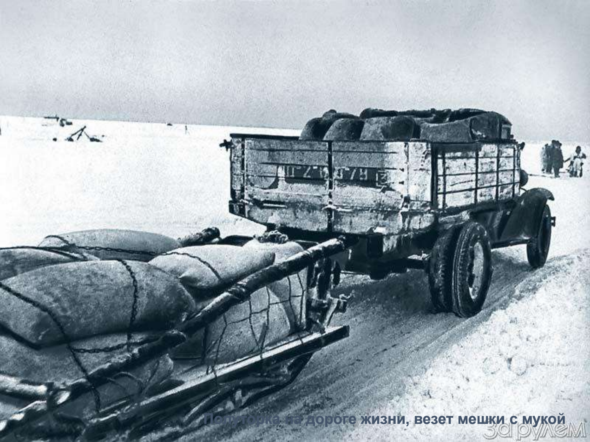
Полторка на дороге жизни, везет мешки с мукой